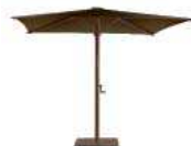
Estructura: Bronce Frame: Bronze Tela: Bronce Fabric: Bronze