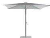
Estructura: Anodizado Frame: Anodized Tela: Aluminium Fabric: Aluminium