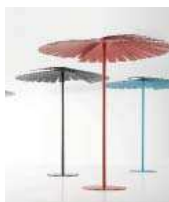
SOMBRILLA ENSOMBRA//PARASOL. BASE. PARASOL. BASE