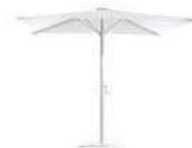
Estructura: Blanco Frame: White Tela: Blanco Fabric: White