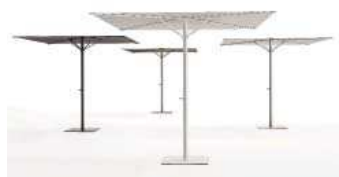
SOMBRILLA BALI//SOMBRILLA. PARASOL