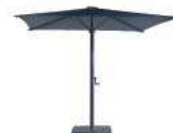
Estructura: Antracita Frame: Anthracite Tela: Antracita Fabric: Anthracite