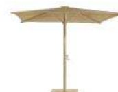
Estructura: Arena Frame: Sand Tela: Arena Fabric: Sand