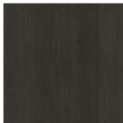
Bois massif Chêne charbon

Les matériaux, tissus, cuirs, couleurs et finitions sont approximatifs et peuvent légèrement différer de la réalité. Vous pouvez retrouver la collection complète des tissus et cuirs Bonaldo sur le site https://bonaldo.biz